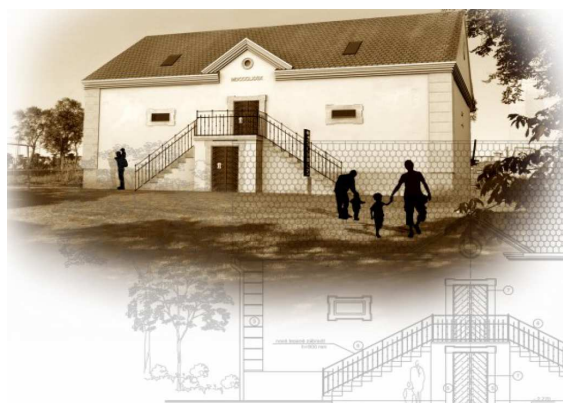
Obnova historické budovy špýcharu

Zastupitelstvo hledalo cestu, jak za rozumné finanční prostředky opravit i tuto stavbu a odsouhlasilo záměr v budově zřídit expozici regionálního muzea rybníkářství a rybářství. Tímto způsobem lze získat až 90% nákladů projektu, realizovaného od roku 2009.