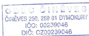
..... Ing. Zuzana Bittmanová Starostka

Přílohy: Tabulka Ceny stočného za 1 m 3 za jednotlivé roky od roku 2007 - 2015 Tabulka průtoků odpadních vod na ČOV v Činěvsi od roku 2006 - 2015 Výkazy zisku a ztráty od roku 2007 - 2015 Protokol o kontrolním zjištění ČÍŽP ze dne 19.1.2012 Usnesení ČÍŽP ze dne 19.2.2013